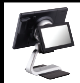
Deuxième écran 7"