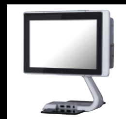
T3 avec base supérieure avancée