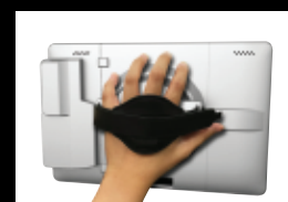
Détachable pour la mobilité